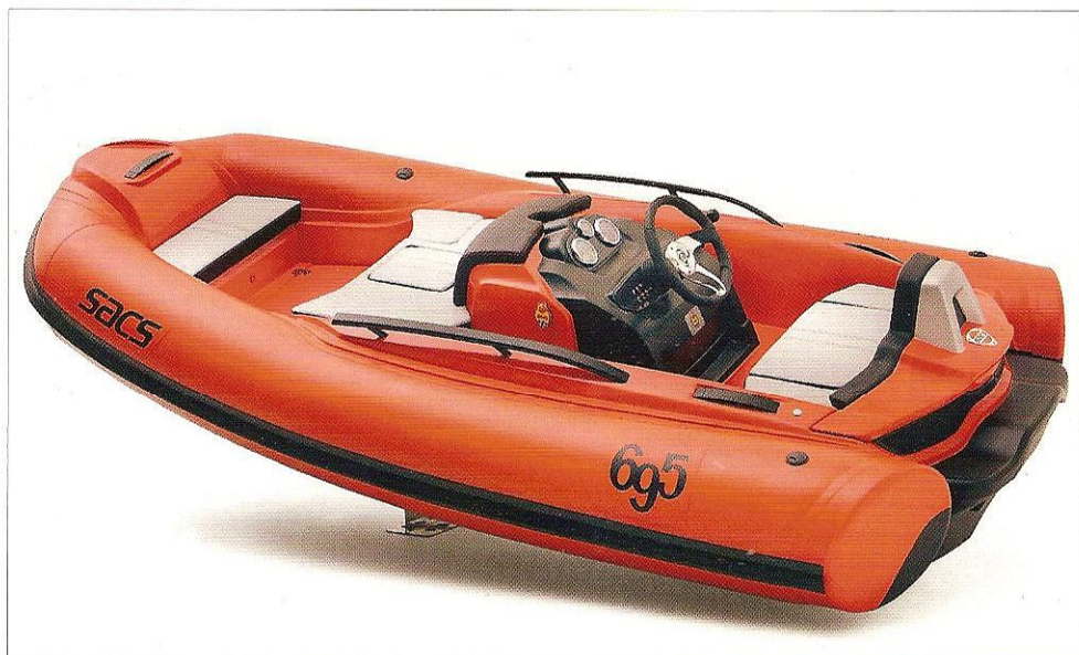
Edizione limitata a 199 esemplari per Sacs - Abarth 695 Tributo Ferrari: un mini tender nato dalla collaborazione tra il costruttore di gommoni, l'atelier motoristico e Christian Grande Design Works.

riuscire a trovare il giusto equilibrio tra le diverse percezioni sensoriali e far durare tale equilibrio nel tempo. E per "sentire" tutti i particolari, percepire ogni dettaglio di uno yacht, i progetti su carta, in 3D, i rendering, non saranno mai paragonabili al salire a bordo e toccare con mano ogni cosa.»